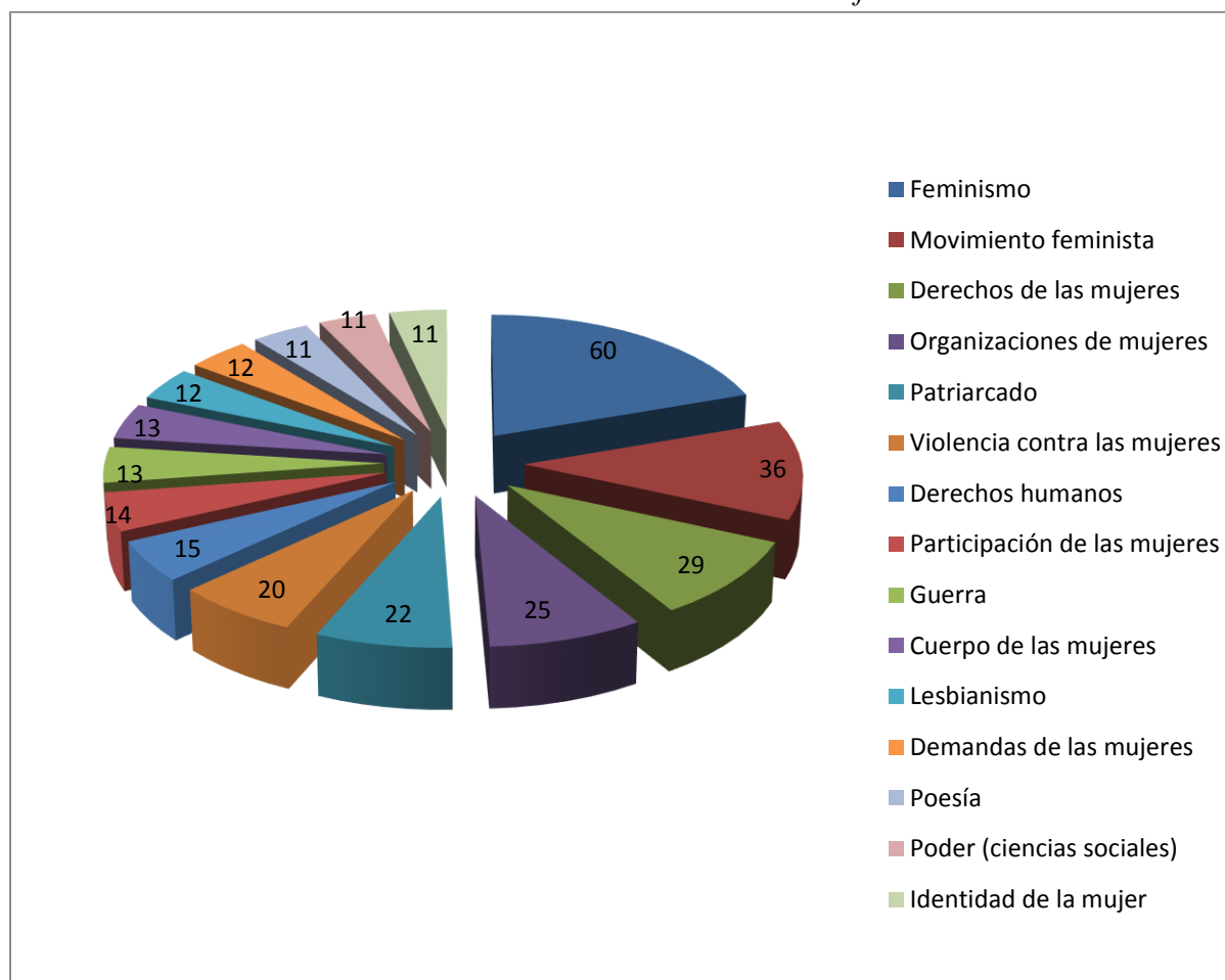
GRÁFICA 1. Temas frecuentes en La Correa feminista